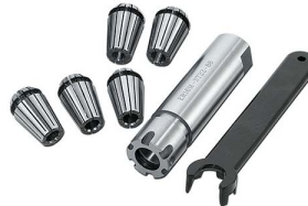
Sada klieštín 3-7 mm / 5 ks + adaptér

Objednací číslo 8309006 Cena bez DPH 168 Kč Cena s DPH 203 Kč