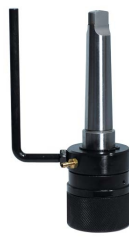
metalkraft Unášacia hlava MK3 / Weldon 19 mm Quick (s chlazením)

Objednací číslo 3876018 Cena bez DPH 216 Kč Cena s DPH 261 Kč