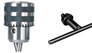
metalkraft Sklučovadlo 1 - 16 mm a klíč

Objednací číslo 3876007 Cena bez DPH 52 Kč Cena s DPH 63 Kč