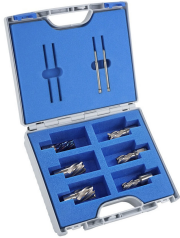
Sada jadrových vrtáků SILVER-LINE 25 + vrták BLUE-LINE

Objednací číslo 3873008 Cena bez DPH 152 Kč Cena s DPH 183 Kč