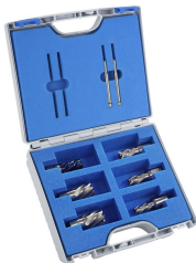
Sada jadrových vrtákov SILVER-LINE 25 + vrták BLUE-LINE

Objednací číslo 3873008 Cena bez DPH 152 Kč Cena s DPH 183 Kč