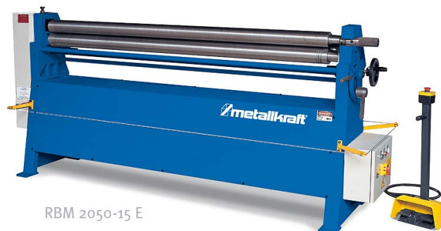
RBM 2050-15 E

Stabilní výkonná zakružovačka plechu se samostatně nastavitelnými válci a nožním ovládním pro průmysl a řemeslné dílny. Pracovní šířka 2,05 m, tloušťka plechu max. 1,5 mm.