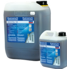
Karnasdi PROFESSIONAL TOOLS MECUTOIL 100, 10 kg

Objednací číslo 38760.110025 Cena bez DPH 35 Kč Cena s DPH 42 Kč