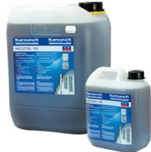
Karnasdi PROFESSIONAL TOOLS MECUTOIL 100 (2,5 kg)

Objednací číslo 1011 Cena bez DPH 44 Kč Cena s DPH 53 Kč