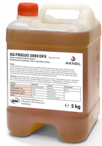
Chladič kvapalina AG FRIGUO 2000 DFX, 5 kg

Objednací číslo 1011 Cena bez DPH 44 Kč Cena s DPH 53 Kč